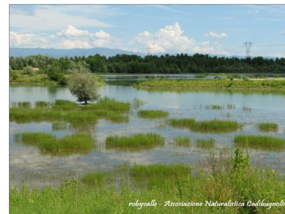
robbyvalle - Associazione Naturalistica Codibugnolo